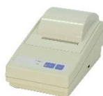
ドットインパクト (普通紙)