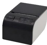
サーマルプリンタ PR-28T