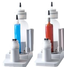
ビュレットヘッド H-3000シリーズ (容量 1,5,10,20,50mL)